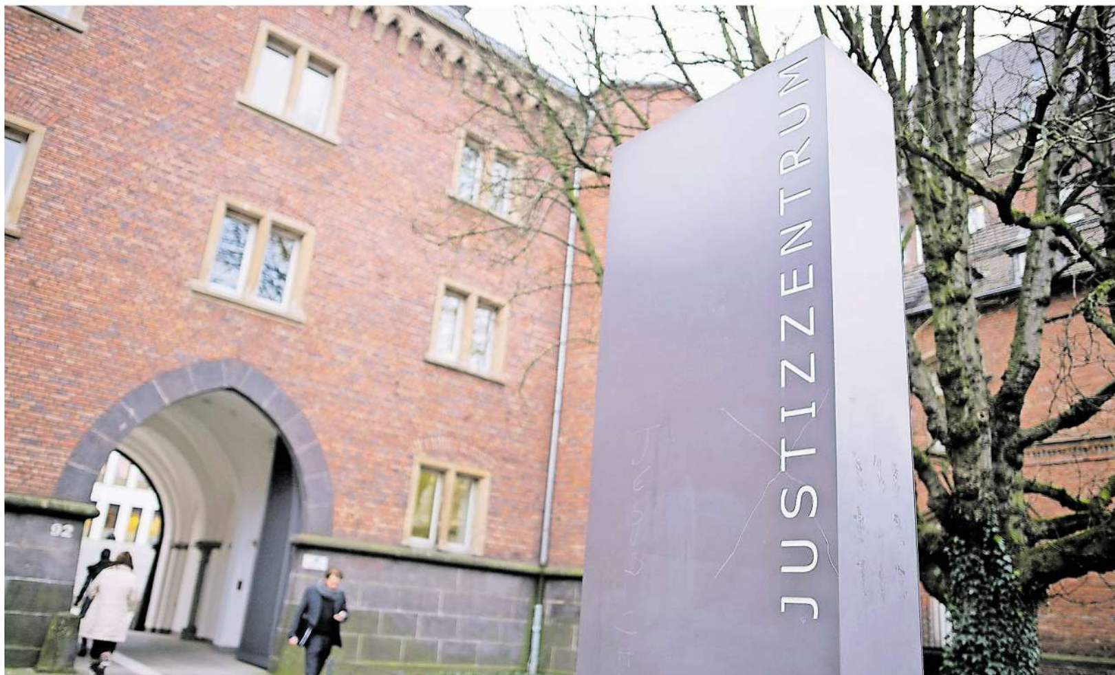
„Heimtückisch und hinterhältig“ nannte der Vorsitzende Richter der Aachener Schwurgerichtskammer, Roland Klösgen, die Tat in der Urteilsverkündung.

Dass ihr neuer Partner im Haus war, entpuppte sich als Glücksfall. Denn der Mann konnte verhindern, dass Ingo S. ungehindert ins Haus kam. Der Freund wurde selber dabei durch Messerstiche verletzt. Man habe juristisch nicht nachweisen können, so der Richter beinahe