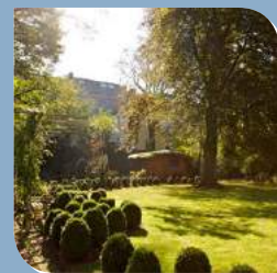
Kontakt Seite 14

„...ein Höchstmaß an Eigenständigkeit und Individualität zu bieten – ganz einfach das gute Gefühl, zu Hause zu sein.“