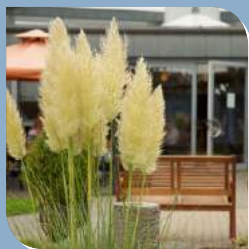
Heinrichs-Gruppe Seite 4-5