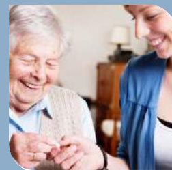
Leistungsspektrum Seite 10-13