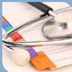
Qualität Seite 8-9